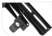
Cierre de seguridad