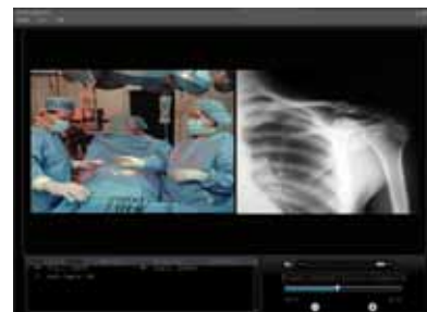
Plantilla con 1 señal VGA + 1 señal video HD