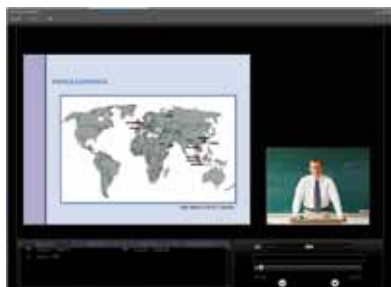
Plantilla con 1 señal VGA + 1 señal video