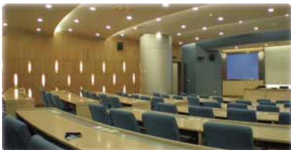
Servidores especialmente diseñados para la formación a distancia.