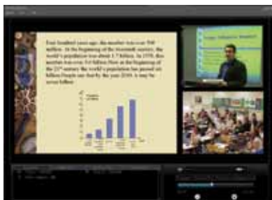
Plantilla con 1 señal VGA + 2 señales video