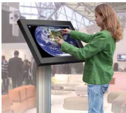
Aplicación para quiosco interactivo

La serie Multi-user Touch Philips está equipada con tecnología IR táctil. En la parte superior de la pantalla LCD se forma una red invisible de infrarrojos y cuando la superficie se toca con un dedo, incluso con un guante o un objeto, la red se interrumpe y se genera el contacto. Philips ofrece cuatro pantallas en tamaños de 32" y 42", basada en la tecnología infrarroja táctil, que pueden procesar 6 o 32 puntos de contacto simultáneamente, esto es ideal para aplicaciones que necesiten ser controladas por múltiples acciones de contacto simultáneas. La serie de monitores Philips Multi-user Touch le permite trabajar con las aplicaciones de las pizarras interactivas disponibles para pantallas táctiles, así como con las aplicaciones de Windows®.