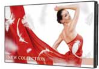
BDL4675XU (46") BDL4681XU (46")