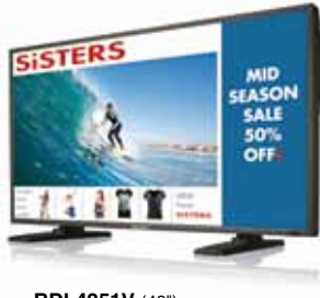
BDL4251V (42") BDL4651VH (46")