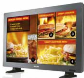
BDL3215E (32") BDL4225E (42")

Los equipos Philips para señalización digital permiten la eficiencia energética y una gran calidad de imagen con un alto grado de fiabilidad y garantía postventa.