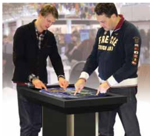
Aplicación para mesa interactiva