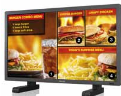
BDL4230E (42") BDL6531E (46")