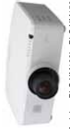
Modelos: PLC-XM100L, PLC-XM150L, PLC-WM4500L, PLC-WM5500L, PLC-ZM5000L,