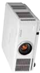
Modelo: WD8200U, UD8400U, XD8100U