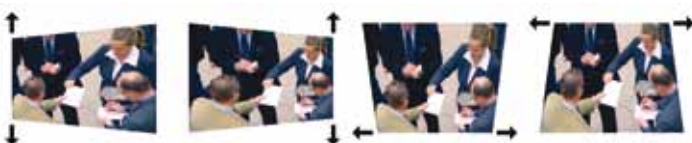
Corrección Keystone digital

El efecto keystone es la deformación de la imagen en forma de trapecio. Se produce al no situar el proyector directamente frente a la pantalla de proyección. El efecto puede ser vertical u horizontal. La corrección keystone horizontal digital permite situar el proyector a un lado u otro de la sala, siendo más versátil y cómodo para el usuario.