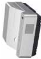
Modelos: PDG-DXL2000, PDG-DWL2500