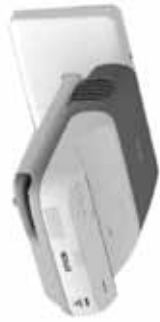
Modelos: EB-440W, EB-450W, EB-455Wi, EB-460, EB-465i