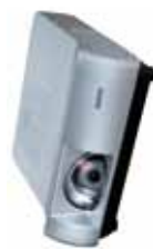
Modelos: PLC-WL2500, PLC-WL2503