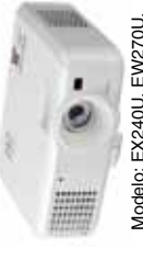
Modelo: EX240U, EW270U, EX320U, EW330U