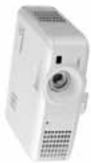
Modelo: ES200U, EX200U