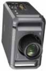
Modelos: PDG-DET100L, PDG-DHT8000L