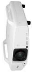
Modelos: EB-Z8000WU/NL, EB-Z8050W/NL