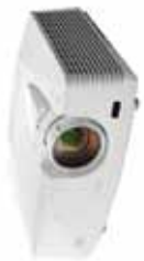
Modelo: XD600U, WD620U