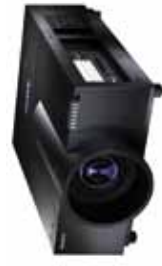
Modelos: PLC-XF1000, PLC-HF10000L