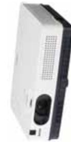
Modelos: PLC-XD2200, PLC-XD2600